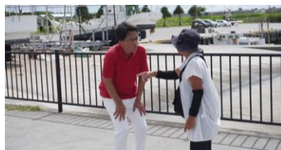
街頭演説での一コマ