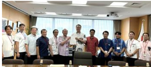
中部10市町村長らと一丸となって中部の振興発展を岡田沖縄担当大臣に要請