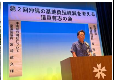
「沖縄の基地負担軽減を考える議員有志の会」in 山口県岩国市