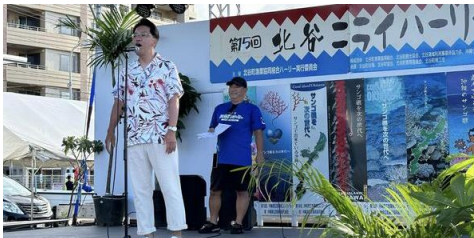
北谷ニライハーリー開会式