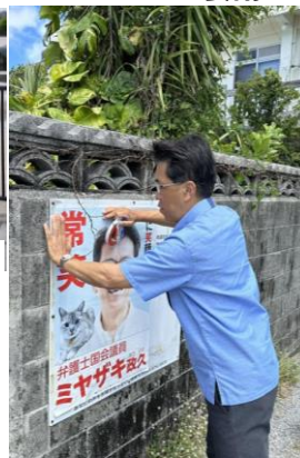
広報活動も重要です!