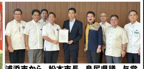
浦添市から、松本市長、島尻県議、与党市議団、又吉商工会議所会頭らとともに要請