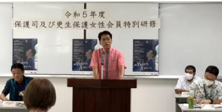
令和5年度 保護司及び更生保護女性会員特別研修 沖縄県更生保護協会理事長として保護司と更生保護女性会の皆様に講話