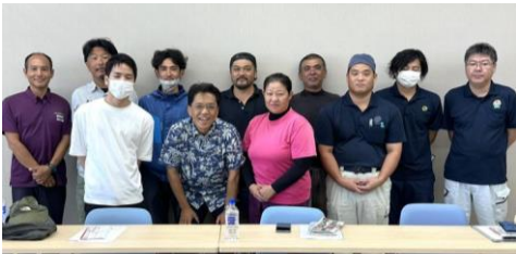
読谷村の若手農家の皆さんとの意見交換

前回の選挙で公約した「現代版万国津梁プラン」(沖縄の子供たちに県内の外国人家庭へのホームステイを公費で提供する)が内閣府の「沖縄国際交流体験推進事業」として実現しました。週末の三日間、県内でのホームステイを通じて「言葉が、思いが通じた」、「私にもできました」という成功体験を積むことができました。こうした成功体験は、沖縄の子供たちが世界に羽ばたき活躍する大きなきっかけとなるものと確信しています。 そして、その先には「沖縄の子供ってみんな英語が話せるんだよね」みんな笑顔の沖縄を作りませんか? 初年度である今年は、県内の小学校三年生から高校三年生までの二千人が体験します。