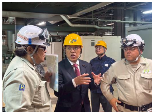
沖縄電力具志川火力発電所。沖縄本島の主力電力所です。