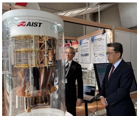
産業技術総業研究所で量子コンピュータ研究の視察