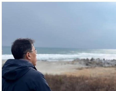
東日本大震災から14年、復興は道半ば。福島県浪江町にて