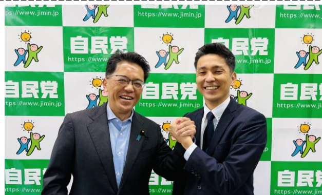
奥間亮氏が参議院沖縄選挙区に挑戦。自民党若手のホープです。ご期待ください。