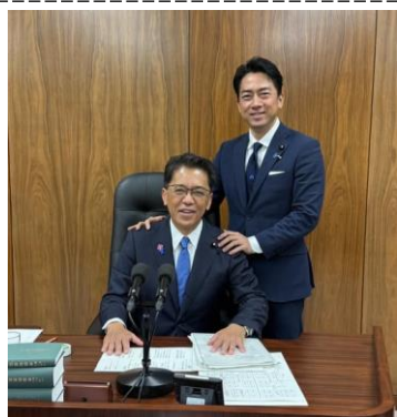
経産委員会筆頭理事の小泉進次郎議員と