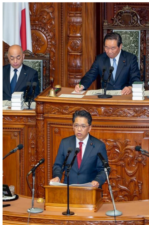
衆議院本会議で審議の経過を報告