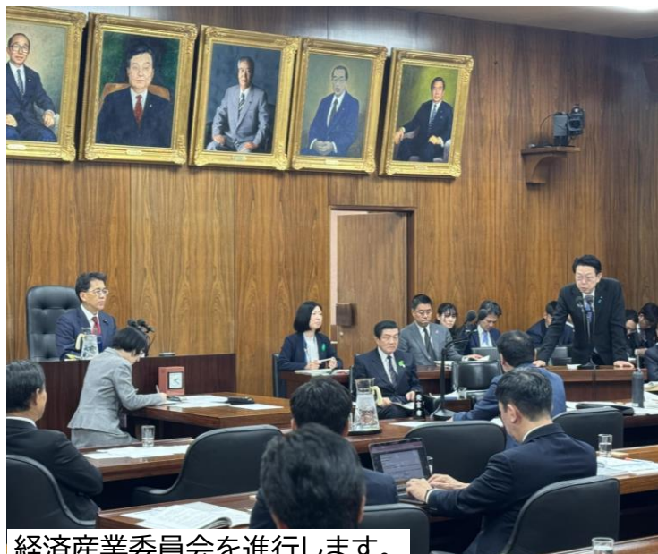
経済産業委員会を進行します。