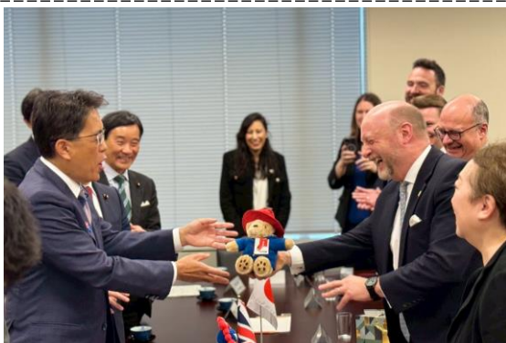
イギリス下院議員団と産業貿易分野で意見交換