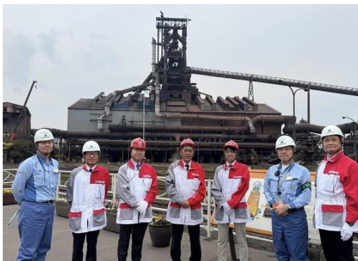
粗鋼生産世界4位の日本製鉄君津製鉄所。GX推進にも取り組んでいます。