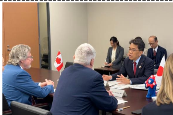
カナダ国会議員団とトランプ関税への対応など意見交換