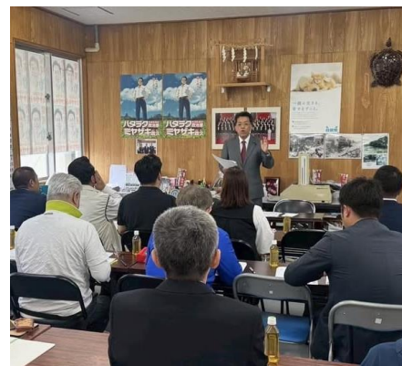
トランプ関税で緊急勉強会