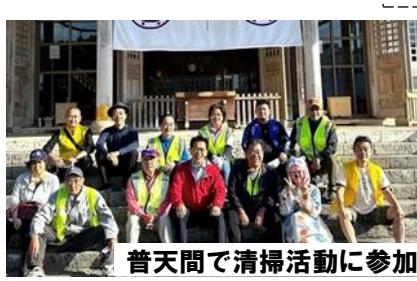
普天間で清掃活動に参加