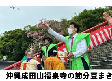
沖縄成田山福泉寺の節分豆まき