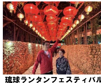
琉球ランタンフェスティバル