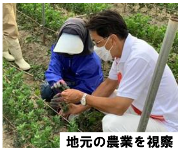
地元の農業を視察